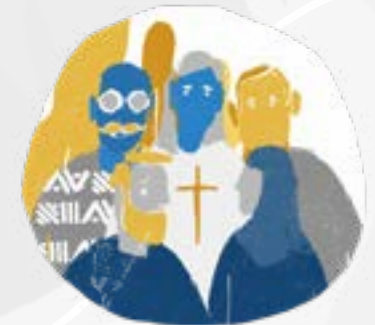
5. Blir döpta och startar församling