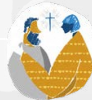
3. Hitta öppna hjärtan som delar sin tro